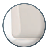
MTPADS-M Gris claro - Metal