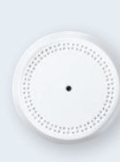
Détecteur de bris de verre