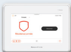
Écran 7 pouces (17,78 cm) tout-en-un