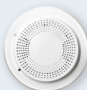
Détecteur de fumée