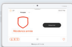
Écran tactile de 7 pouces (17,78 cm) (sans fil)