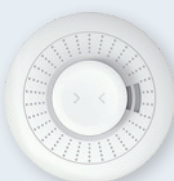
Détecteur de chaleur