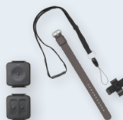
Boutons d'alerte et d'urgence médicale