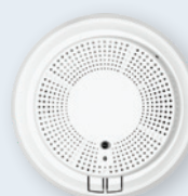
Détecteur combiné de fumée et monoxyde de carbone