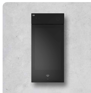
2N® IP STYLE (SOPORTA TARJETAS SEGURAS) 9157101-S